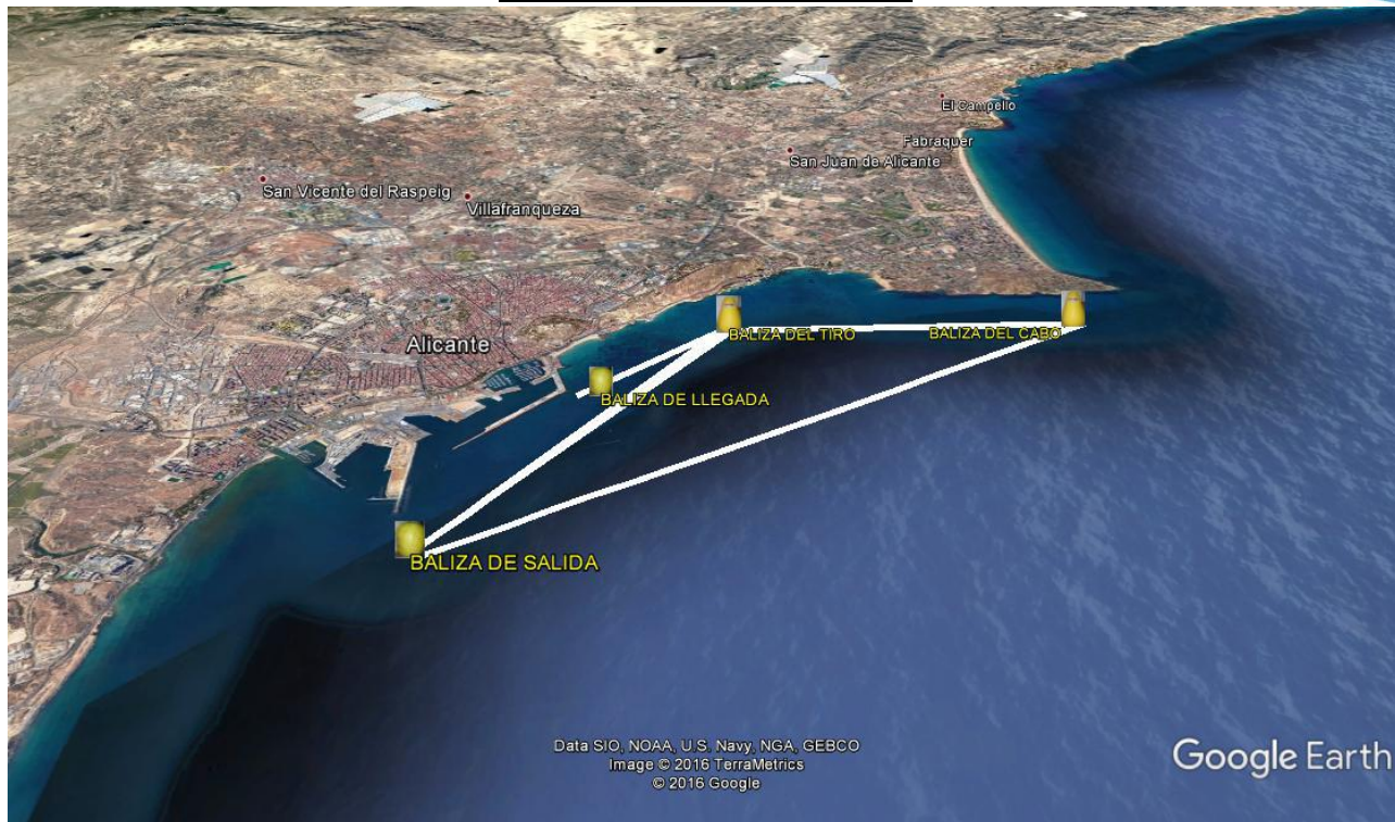
RECORRIDO ORC 1y2